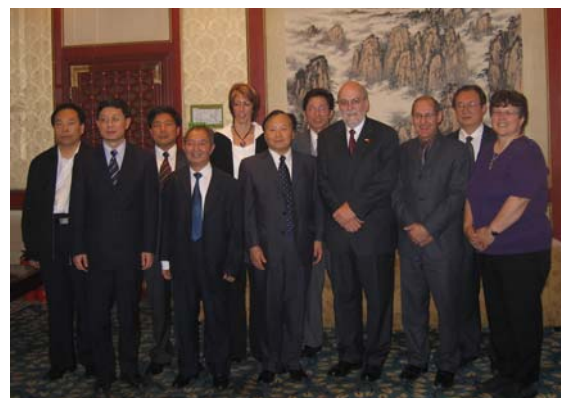
2006年10月加拿大全国假释委员会太平洋地区副主席斯伯克女士(右一)在北京会晤中国监狱协会人士。

全国假释委员会会考虑犯人的犯罪历史，其静态及动态的犯罪行为成因，其透过实践矫正计划去针对其犯罪因素的进度及监管该犯人风险的释放计划之可行性。全国假释委员会并参考可得资料，其中包括由警方报告、法官评论、判刑前的报告、心理医生及精神医生报告、被害者所受的冲击声明书及矫正局提供对犯人的风险程度及释放计划的分析和意见。