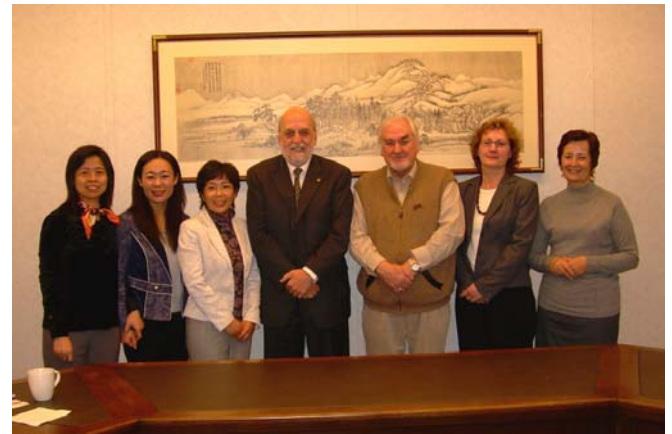
2007年11月13日《检察日报》两位记者(左二、左三)访问国际中心。

2007年11月13日国际中心接待了两位来自中国《检察日报》的记者。这是国际中心的“中加检察改革合作项目”的活动之一——邀请中国的法制记者访加采访。这一活动的目的是了解加拿大的司法制度和检察制度，做比较研究，向中国的检察官介绍加拿大的刑事司法制度以及中国和加拿大在司法改革方面所做的努力。