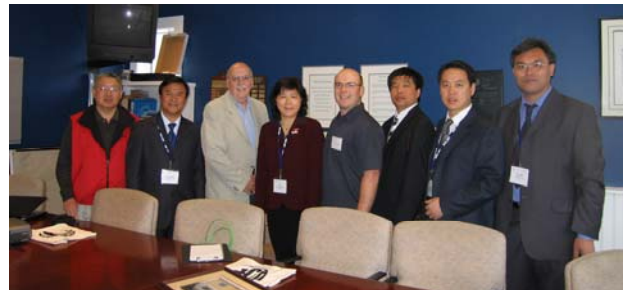
中国代表团2007年6月24日访问约翰爱德华协会。