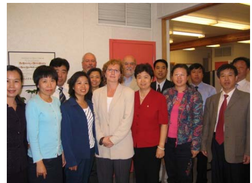
2007年9月11日北京市司法局代表团访问位于不列颠哥伦比亚大学校园的加拿大刑法改革与刑事政策国际中心。

参加以上活动及本期提到的其它活动的中国代表进一步促进了中加两国矫正工作者之间的相互尊重和了解。双方将继续实施对犯罪人员的人情化管理,建立更加安全的社区,继续对双方的工作提供支持。